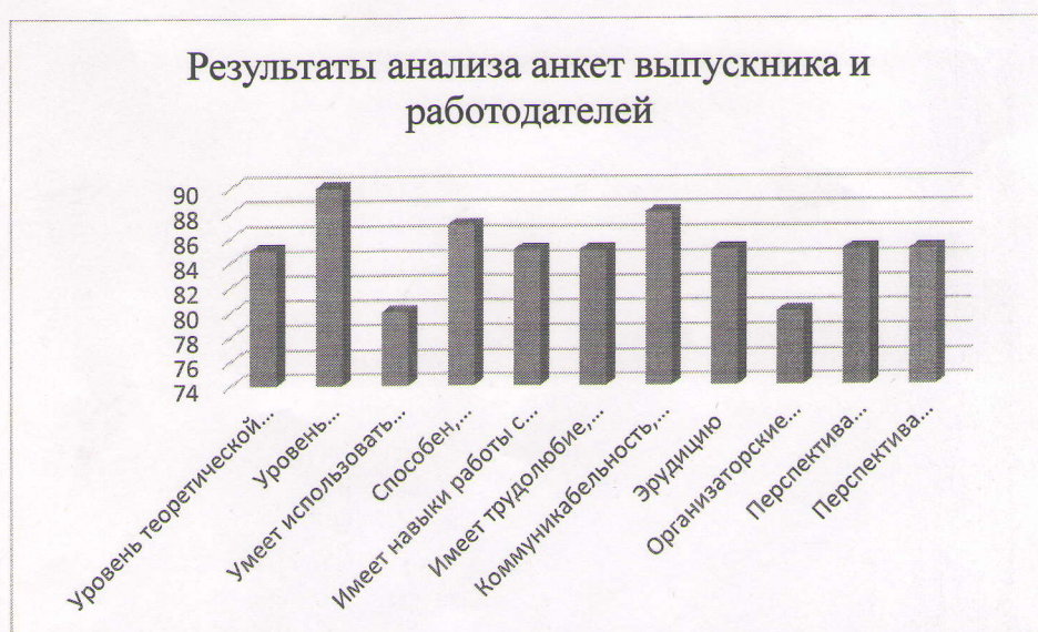
Рисунок 1- Результаты анализа анкет выпускника и работодателей

Для более наглядной формы нами была представлена диаграмма по результатам анализа внешней оценки организации учебного процесса (см. рис 1).